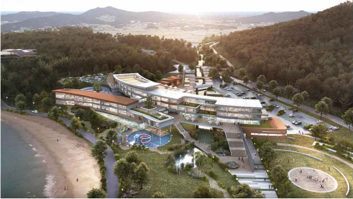
[신안 경찰수련원 신축 조감도]