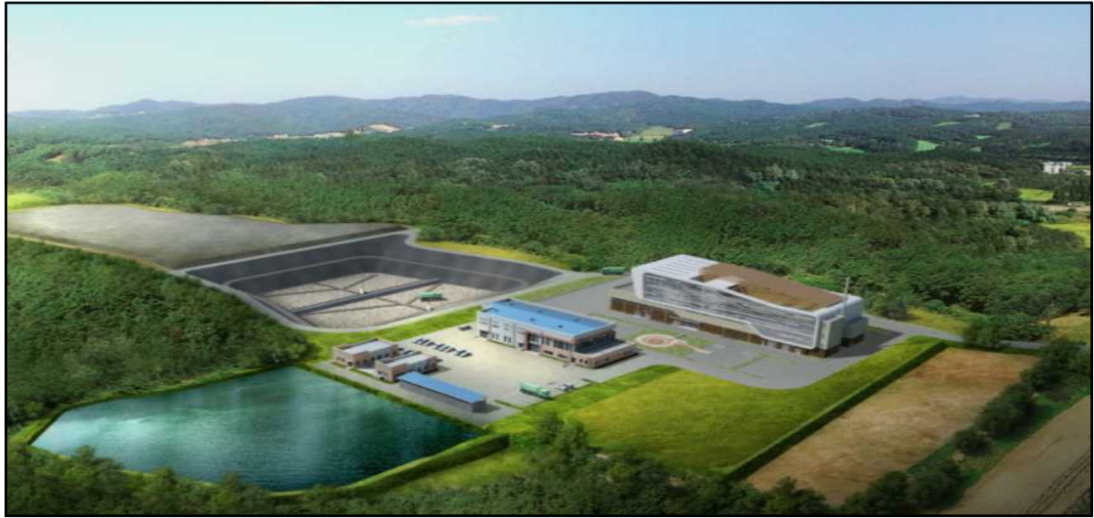
(하동군 제2 생활폐기물처리장 조감도)