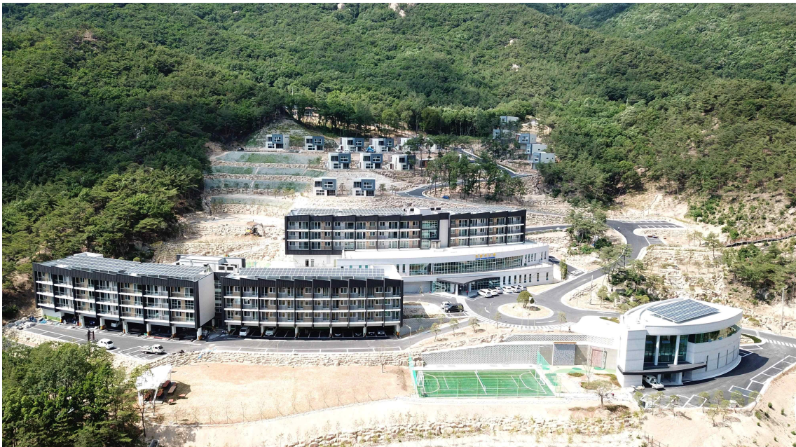
[제천 경찰수련원 전경]